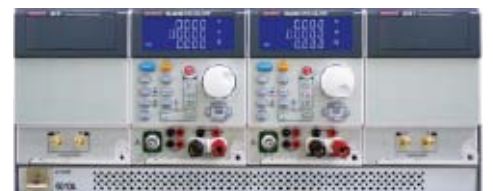
60104为6010测试模块的机框