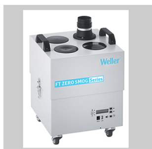
Fume extraction devices